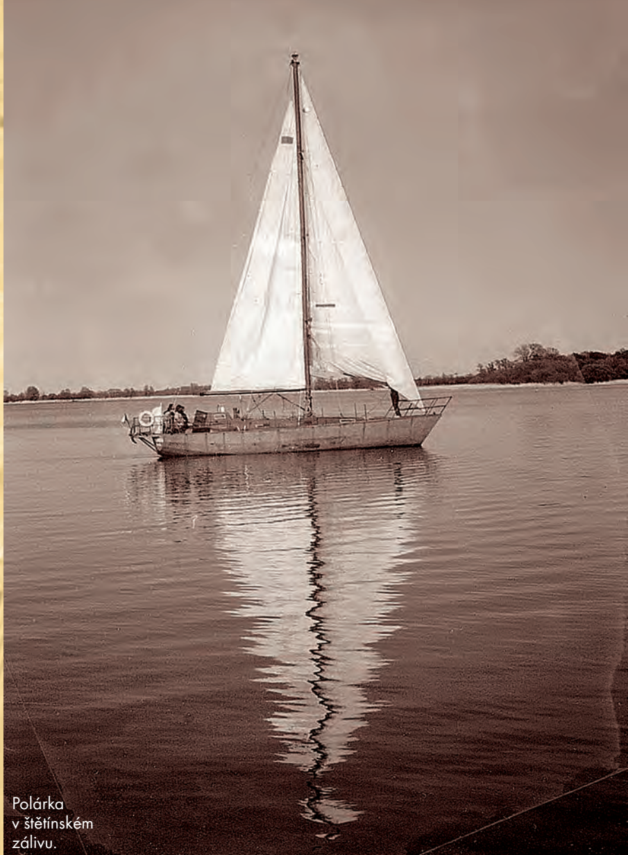
Polárka v štětínském zálivu.

Těď žádné lidi vědomě nehledám. Chtěl jsem vždycky, aby si mě našli sami. Aby to byla jejich iniciativa. Ale udělal jsem jednu akci v souvislosti se stavbou plachetnice Victoria, to bylo v roce 1995, byla to taková celorepubliková akce, kdy jsem posbíral lidi z ulice, postavil s nimi historickou plachetnici a přeplul s nimi z Evropy přes Atlantik bez motoru, což byl tenkrát už nemyslitelný výkon. Doppluli jsme do Ameriky, kde jsem jim loď dal, oni pluli dál kolem světa a já jsem přesedlal na Polárku a plul na dva roky do Grónska. Protože moje specialita, a to