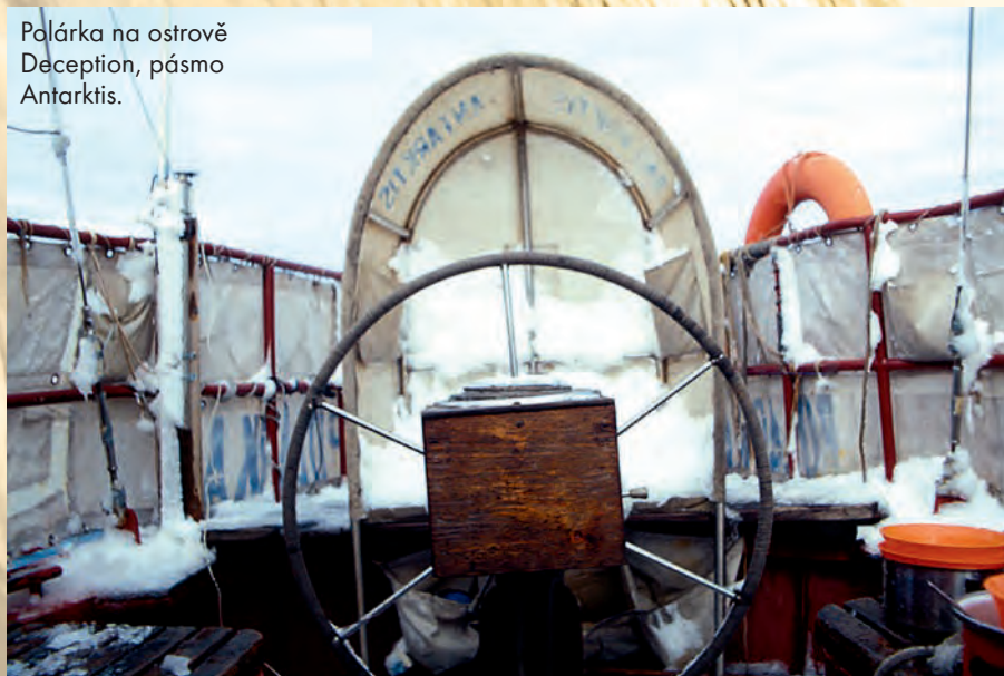
Polárka na ostrově Deception, pásmo Antarktis.

Kam až se vám v dobách komunismu podařilo doplout?